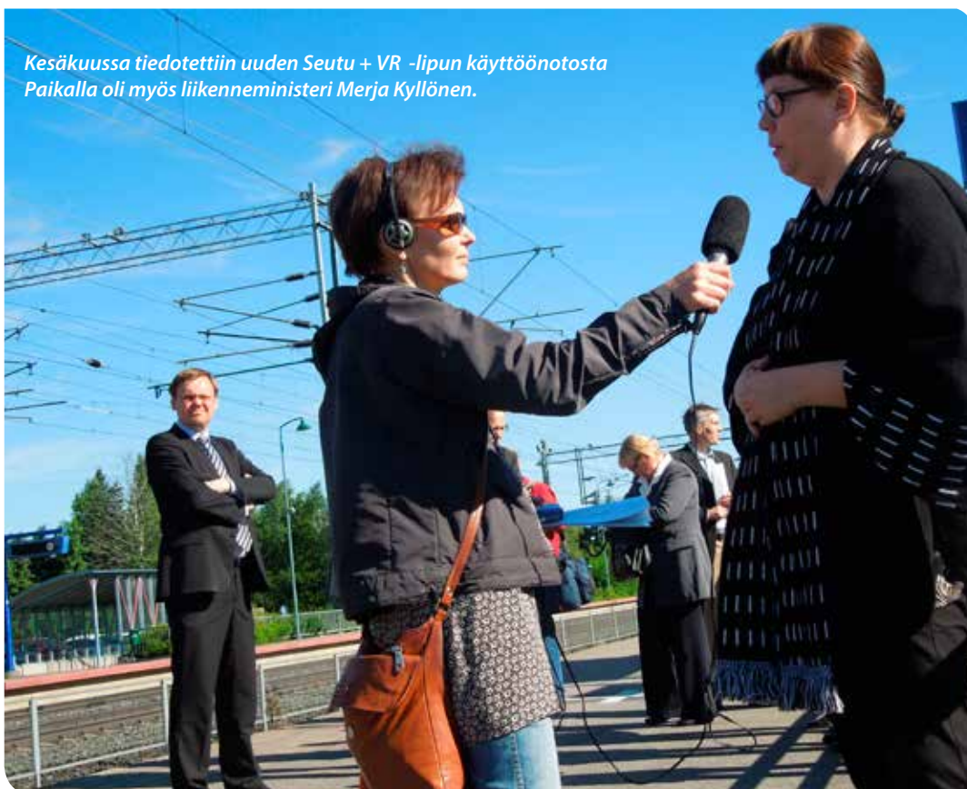
Kesäkuussa tiedotettiin uuden Seutu + VR -lipun käyttöönotosta. Paikalla oli myös liikenneministeri Merja Kyllönen.

Vihreällä viikolla kesäkuussa sai kertalipulla lunastaa matkakortin maksutta. Liikkujan viikolla syyskuussa tamperealaisissa ravintoloissa jaettiin tuopinalusia, joita näyttämällä pääsi bussissa ilmaiseksi kotiin. Kampanjassa olivat joukkoliikenteen lisäksi mukana Ekokumppanit ja Liikenneturva. Joulukuussa joukkoliikenne osallistui Tampereen Joulutorille. Joukkoliikenteen logo oli näkyvissä Joulutorin mainoksissa, ja joukkoliikenteellä oli iso seinämainos torilla.